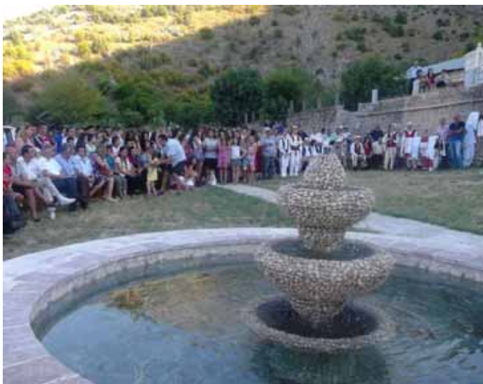
Pamje nga aktiviteti