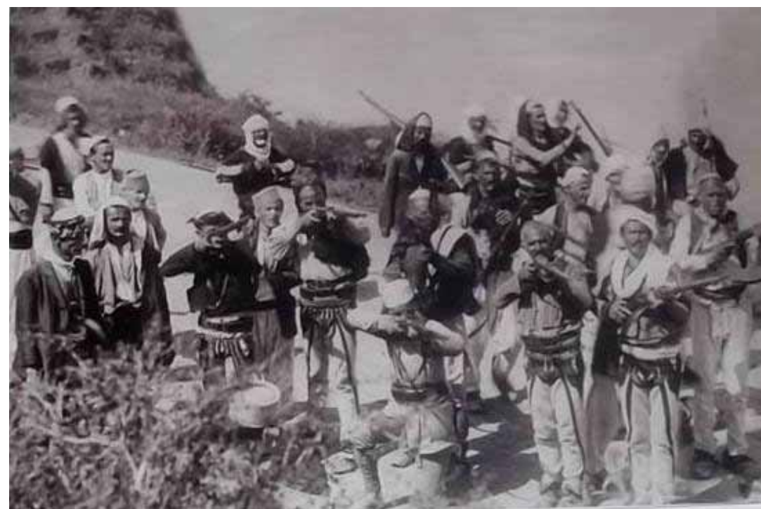
Foto e luftëtarëve dukagjinas në Bratilë

dhur për pushime nga Amerika e largët. Pas një prezantimi të shkurtër, udhëtimi vijoi për tek Shtëpia muze e Ded Gjon Lulit. Ishte emocionuese për të gjithë në të gjendesh në krahinat shqiptare, të cilat dhe sot përcjellin jehonën e shekujve. Valëvitja e Flamurit Nacional në oborrin e shtëpisë muze të përkëdhelë dhe shpaloste para nesh nëpërmjet vëllezërve hotjan historinë e këtyre krahinave shqiptare. Ishte kënaqësi të dëgjoje tek flisnin me radhë të gjithë në lidhje me historinë dhe çdo element të kësaj shtëpie muze. Më bëri përshtypje dëshira e madhe për të folur për historinë dhe njohja edhe në detaje më intime të kësaj historie të lavdishme. Për ne dukagjinastë emocionuese ishte edhe një foto e luftëtarëve Dukagjinas pjesëmarrës në ngritjen e Flamurit në Bratilë.