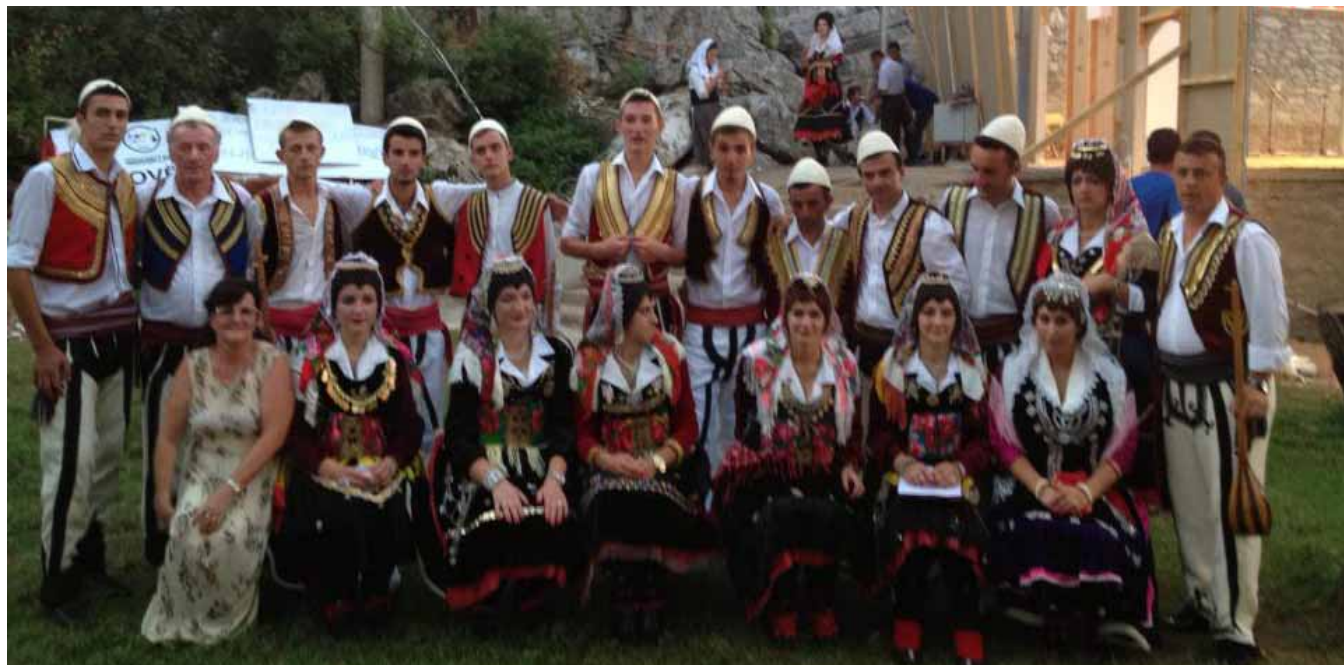
Grupi i shoqates kulturore artistike "Jehona e Kelmëndit"

"Jehona e Kelmëndit", ka qënë me shtatë anetar në grupin Folklorik të Qa-