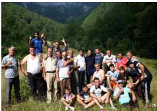
Grupi i piknikut në breg të Bubës

në Qafë të Valbonës. Tradicionalisht kjo qafë quhej “Qafa e Balbonës”, por nga gjysma e dytë e shekullit të kaluar e në