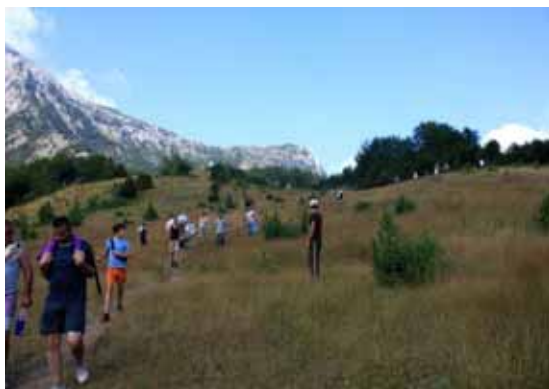
Grupi i piknikut duke ecur në hapësirën e bregut të Bubës

vazhdim erdhi duke u përforcuar emërtimi “Qafa e Valbonës”.