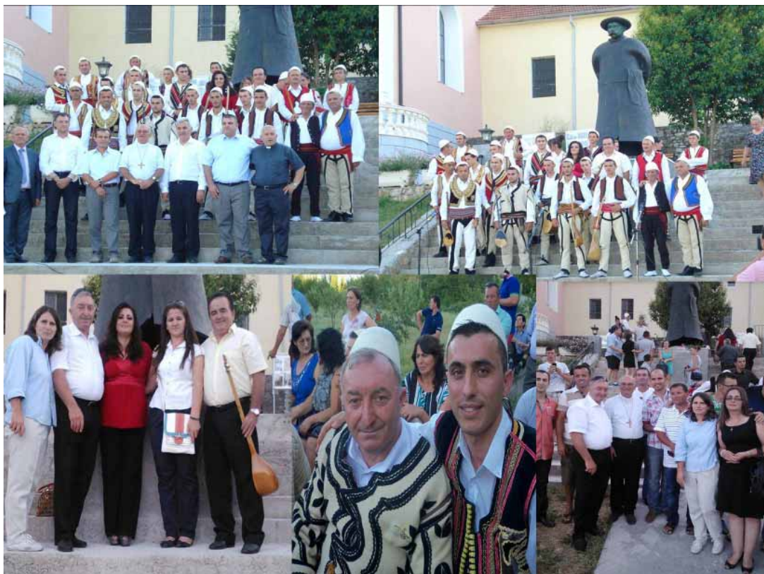
Pamje nga veprimtaria

Veprimtaria e Tretë , ishte vizita që disa përfaqësues të Shoqatës "Atdhetare-Dukagjini" bënë në krahinën e Hotit. Të ftuar nga Shoqata Kulturore Artistike «Ded Gjon Luli», me datën 13 Gusht 2013, dite e marte, në orët e pasdites udhëtuan për në Hotin legjendar. Në doganën e Hanit të Hotit kishin dal për të na pritur vëllezërit tonë hotjan, disa prej tyre kishin ar-