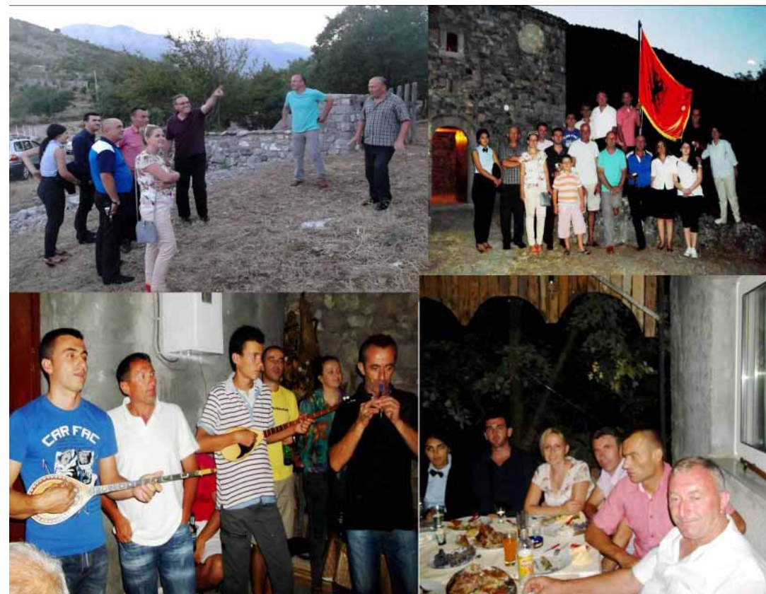
Pamje nga veprimtarite në rajonin e Traboinit, përfaqësuesit e shqazës "Atdhetare-Dukagjini"