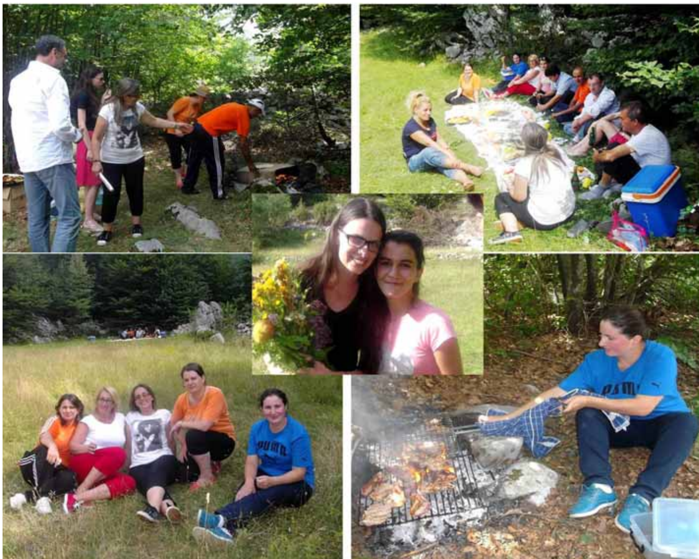
Çastet e drekës në natyrë