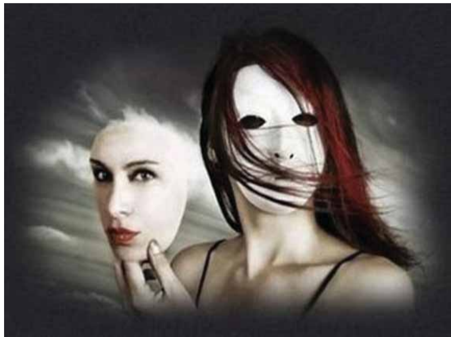
Hiq fytyrën, vendos maskën!

gjysma njeri e gjysma kokë kafshe njerëzore, i cili ushqehet çdo ditë me mishin e djemve e vajzave të reja! Kujdes njerëz! Fasadat janë mashtruese. Mjaft kemi paguar për to! Nëse nuk besoni, patjetër do ta psoni!