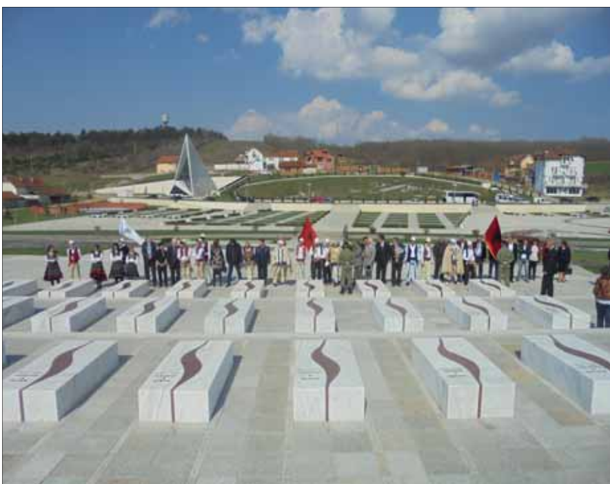
Varrezat e dëshmoreve ne Prekaz

dhe promovimin e vlerave kulturore, artistike e identitare të Kosovës dhe viseve të tjera shqiptare, brenda shteteve fqinje; për bashkëpunim të frytshëm me Shoqatën Atdhetare "Dukagjini" në përmbushjen e misioneve dypalëshe".