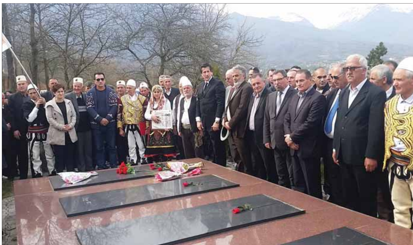
Varresat e dëshmorëve, Novesela