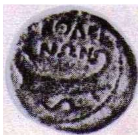
Fig.10. Stema antike ilire e "ΣΚΟΔΡΗΝΩΝ" me anijen labiatane e të tjera

Ne personalisht, kishim propozuar që objekti i cili ndodhet në lartësinë dominuese në akropol, në përputhje me legjislacionin laik aktual dhe pronësinë shtetërore, mbas kërkimeve arkeologjike deri në steril, të restaurohej e të shndërro-