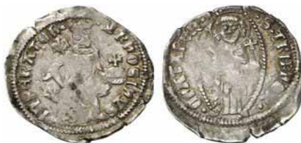
Fig.3. Monedhë e Stefan Uroshit V (1355-1371) me Shën Stefanin