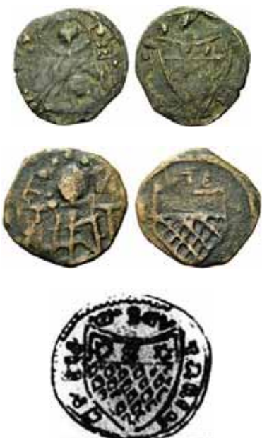
Fig.4. Monedha të Shkodrës autonome me Shën Stefanin, protomartir, Pajtori-Protetori i Shkodrës dhe Stema