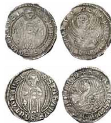
Fig.6. Monedha me Shën Stefanin dhe me luanin venedikas të fund shekullit XIV e XV