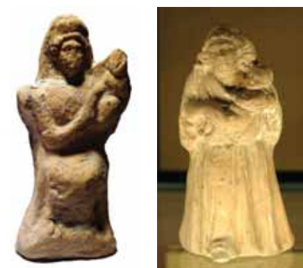
Fig.8. a) Terrakotë e artit arkaik e mijvjeçarit I-II p.e.r. e zbuluar në Shkodër: "Fatia me fëmijë për gjurit" e murosur e sakrifikuar. Publikuar dhe komentuar nga ne, në një emision televiziv lokal; b) Terrakotë, "nana me fëmijë" e gjetur në Tanagra (Graena) Greqi e shek IV-V p.e.r.