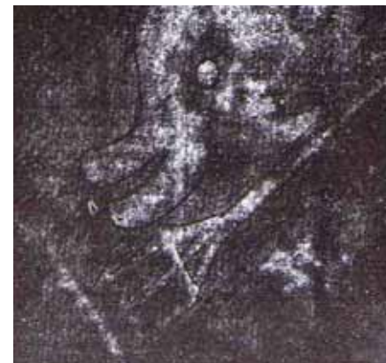
Fig.7. Tritoni/delfini dhe tërfurku i Poseidonit antik, i "robëruar" nën gurë e betonimet anarkiste