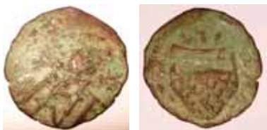
Fig.1. Monedhë bakri mesjetare e Shkodrës njaft e dëmtuar nga koha

Kështu, dijelerët e gjithëdijshëm demokratë i ranë hasha të gjithë traditës shkodrane, ku nuk mungonte as "Çelësi i Shkodrës"... Realisht kjo stema e Shkodrës, ishte gatuar ideologjikisht, teoriki-