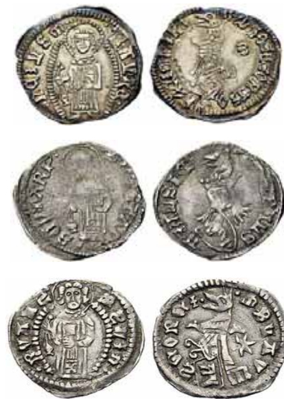
Fig.5. Monedha me Shën Stefan dhe me Stema e simbole heraldike të dinasti families feudale Balshiç

tenca dhe analiza e borgjezisë merkantiliste qytetare republikane të Shkodrës dhe e shtresave proletare. Analizimi i epokës së