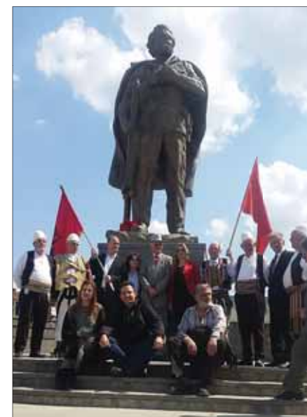
Foto pranë monumentit të Adem Jasharit