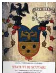
Fig. 9. a-b) Stema mesjetare të shekullit XI-XII, me shqiponjë biqefale të zezë dhe luan, të familjes Shkodrane Lule Frangu. c) Stema heraldike e Komunës Qytetare Republikane të Shkodrës e fundit shek XIV e shek XV, me shqiponjë të zezë me luanin me çelësin në gojë

të shquar J. G. Hahn, ai e pohon qartë se, kristianizmi zgjodhi disa simbolika e shenjtorë fetarë kristiane konkretisht për të mbuluar e varrosur me harresë simbolet e lashta të kulteve ilire. Edhe e ashtuquajtura lojë fjalësh se, Shën Shtjefni nuk na qenka identik me shenjtorin Shën Stefanin protomartirin, që kishin edhe sllavët, nuk qëndron.