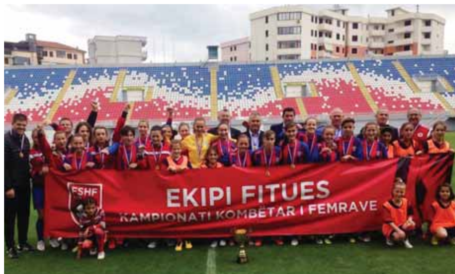
Ekipi i Vllaznisë kampion i Shqipërisë për sezonin 2016-2017 - stadiumi "Loro Boriçi" i Shkodrës

krahas medaljes individuale si pjesëtare e ekipit kampion, ka marrë në dorëzim edhe trifeun e titullit kampion. Moment ky që është shoqëruar me një entuziasëm të ligjshëm, që në këtë rast, kupa ka kaluar në duart e seciles lojtare. Më pas ka ardhur radha edhe e përcjelljes së emocioneve të suksesit, ku e para ka