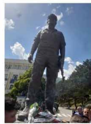
Foto Heroit Legjendar Ne Bronx