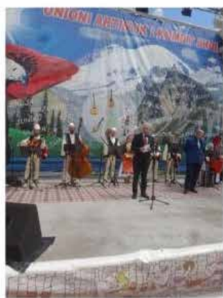
Foto Ali Ahmeti duke sjell kujtimet