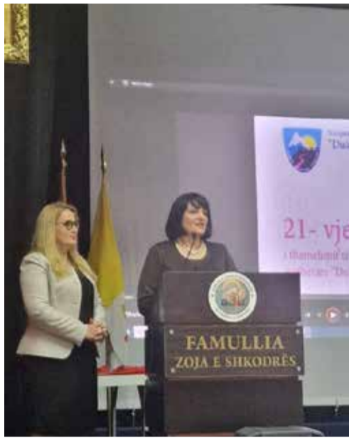
N/kryetarja e bashkisë Shkodër, duke përshendetur pjesëmarrësit

fëmijë ta ndjejnë vetën të mbështetur në ecurinë e tyre. Ata nuk janë vetëm, por të mbështetur nga familja, mësuesit dhe shoqëria. Në arritjet tuaja të deri tanishëm, duhet të dashur nxënës të jeni falënderues ndaj prindërve, që ju sollën në jetë dhe ju krijojnë mundësit për të qenë të lumtur. Të jeni falënderues ndaj mësuesve tuaj, që ju ushqejnë me dije. Kur bëhen bashkë dashuria e përvoja, e prindërve dhe mësuesve me vullnetin dhe talentin tuaj, rezultatet janë gjithmonë të mira dhe ju do jeni të suksesshëm. Ju me rezultatet tuaja