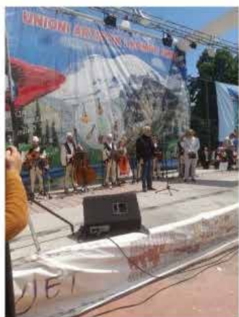
Foto Pandeli Majko fjalën e rastit