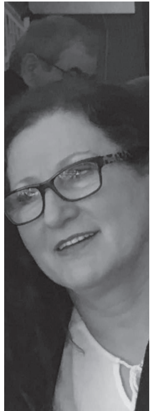
Naj njuh bota Historit Ato ane kush i ka m'sy Erdh me kam e u kthye pa krye

Me naq shpirtin e me shue mallin Vargje fjalsh prej zemre dalin Prej n'Qaf t'Pejs, Puke e Mirdit